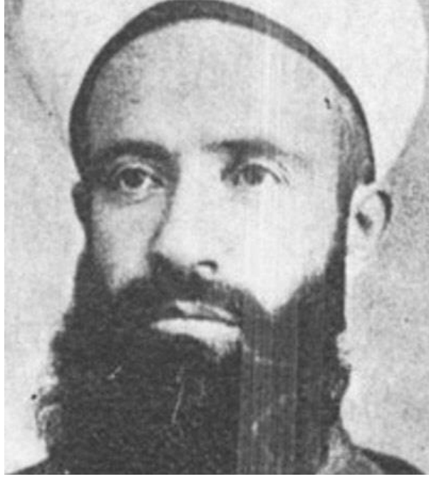
الشيخ محمد جمال الدين القاسمي (دمشق؛ توفي سنة ١٩١٤)

قال القاسمي: "﴿وَتَرَى الْجِبَالَ تَحْسَبُهَا جَامِدَةً وَهِيَ تَمُرُّ مَرَّ السَّحَابِ صُنِعَ اللَّهُ الَّذِي أَتَقَنَ كُلَّ شَيْءٍ﴾ النمل: ٨٨؛ قالوا المراد بهذه الآية تسيير الجبال.. يوم القيامة (ولكن) لا يمكن أن يكون المراد بهذه الآية ما قالوه لعدة وجوه: أن قوله ﴿وترى﴾ لا يناسب مقام التهويل والتخويف، وكذلك قوله ﴿صُنِعَ اللَّهُ الَّذِي أَتَقَنَ كُلَّ شَيْءٍ﴾ لا يناسب مقام الإهلاك والإبادة، وهذه الآية صريحة في إرادة الحال؛ (لأن) خراب العالم لا يراه البشر، وإذا رآه أحد شعر به وهذا ينافي ﴿تَحْسَبُهَا جَامِدَةً﴾؛ أما في الدنيا فلا نشعر بحركة الجبال لأننا نتحرك معها، وهذه الآية في سياق آية ﴿لَمْ يَرَوْا أَنَّا جَعَلْنَا اللَّيْلَ لَيْسَكُنُوا فِيهِ﴾؛ اعتراض في تضاعيف أهوال القيامة، والمراد بهما نكر شيء من دلائل قدرة الله تعالى المشاهدة آثارها في هذا العالم الآن ليكون ذلك دليلاً على قدرته على البعث؛ ولذلك ختم هذه الآية بقوله ﴿إِنَّهُ خَبِيرٌ بِمَا تَفْعَلُونَ﴾ فنذكر هذه الأشياء في هذا السياق كذكر الدليل مع المدلول؛ أو الحجة مع الدعوى، فهذه الآية صريحة؛ وليس يمكن حملها على أن ذلك يقع عند قيام الساعة وفساد العالم وخروجه عن مُتعاهد النظام، حيث هو نقض وإهدام وليس صنع وإحكام، وهذا المرور؛ وإن لم يكن مُبصراً محسوساً، لكنه معجزة للنبي ﷺ؛ إذ لم يُخبر به غيره من الأنبياء" ٣ .