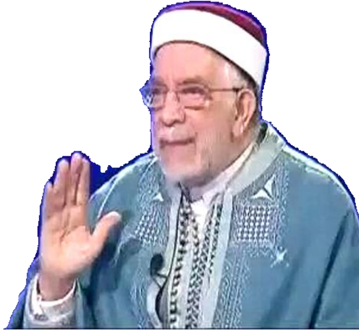
الشيخ محمد الطاهر بن عاشور (تونس: ١٨٧٩-١٩٧٢)

وقال ابن عاشور: "بَوْتَرَى الْجِبَالِ تَحْسِبُهَا جَامِدَةً وَهِيَ تَمُرُّ مَرَّ السَّحَابِ صُنْعَ اللَّهِ الَّذِي أَتَقَنَ كُلَّ شَيْءٍ" (النمل: ٨٨؛ هذه الآية معترضة من تخلل دليل على دقيق صنع الله تعالى في أثناء الإنذار والوعيد، ومر الجبال غير (السير) الذي في قوله تعالى: (ويوم نسير الجبال)؛ وقت اختلال نظام العالم، و(صنع الله) اعتباراً بحالة نظامها المألوف، وفي مادة صنع معنى التركيب والإيجاد، والإتقان إجادة؛ والهدم لا يحتاج إلى إتقان، و(الذي أتقن كل شيء) تعميم؛ أي هو صنع عجيب مُمَاتِلٌ لأمثاله من الصناعات الإلهية، وهذا يقتضي أن مر الجبال من نوع التكوين واستدامة النظام؛ وليس من نوع الخرم والتفكيك، وليس في كلام المفسرين شفاء لبيان وجه تشبيه سير الجبال بسير السحاب، وفي هذا استدعاء لأهل العلم، فهذا من العلم الذي أودع في القرآن ليكون معجزة من الجانب العلمي يُدركها أهل العلم، وخص الخطاب للنبي عليه الصلاة والسلام ادخار لعلماء أمته الذين يأتون في وقت ظهور هذه الحقيقة؛ إذ لا يتعلق بعلمه للناس مصلحة حينئذ، حتى إذا كشف العلم عنه من نقابه؛ وجد أهل القرآن ذلك حقاً في كتابه، فاستلوا سيف الحجة به وكان في قرابه" ٤ .